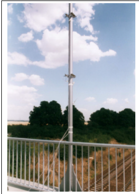
Befestigung der Beschleunigungsaufnehmer an einem Hänger

Im Zuge der Gewerbeverbindungsstraße in Halberstadt Ost wurde eine Stabbogenbrücke in Stahlbauweise über die Bahnstrecke Halle – Vienenburg neu errichtet. Aufgrund der vermehrt auftretenden Problematik der Hängerschwingungen bei Stabbogenbrücken wurden an den kritischen Hängern die Eigenfrequenzen und die Dämpfungsdekrementen experimentell ermittelt.